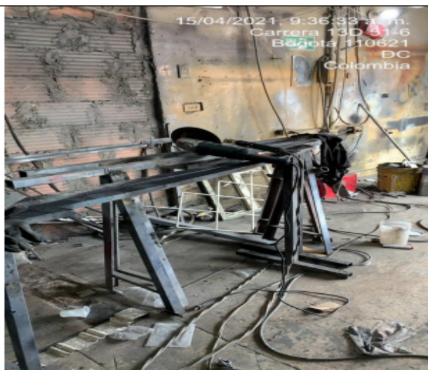
Fotografía No 8. Pulidora.