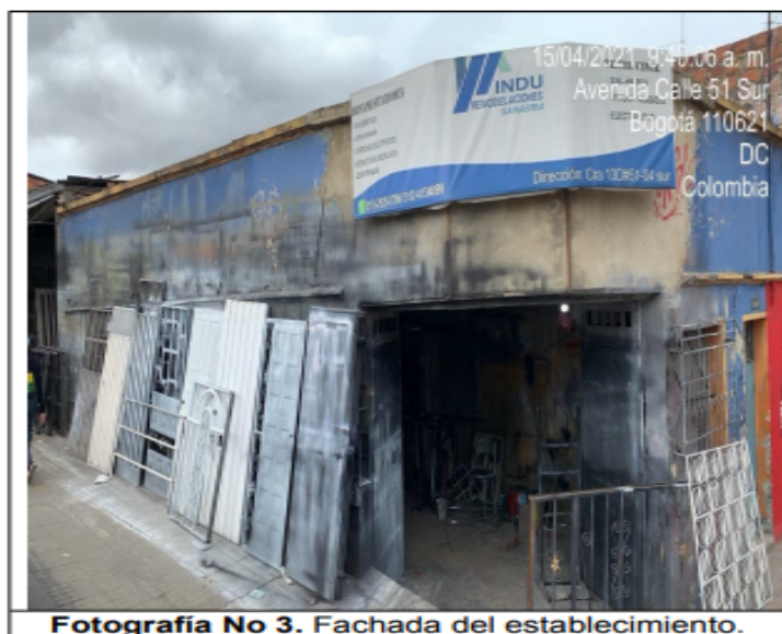
Fotografía No 3. Fachada del establecimiento.