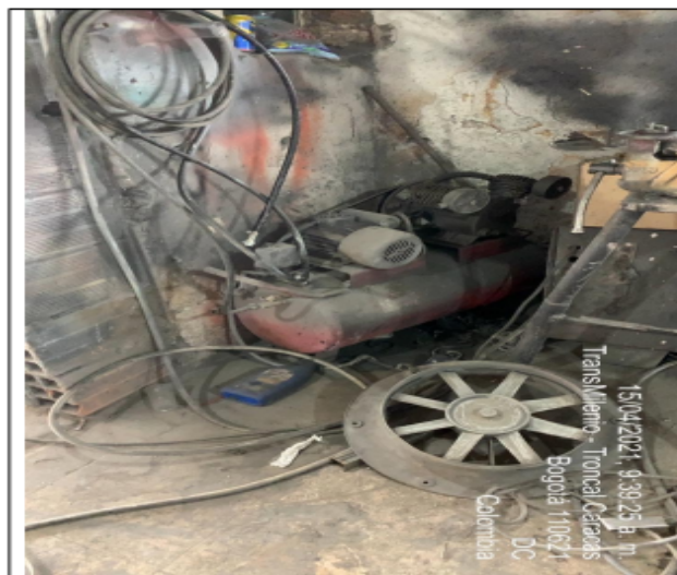
Fotografía No 7. Compresor.